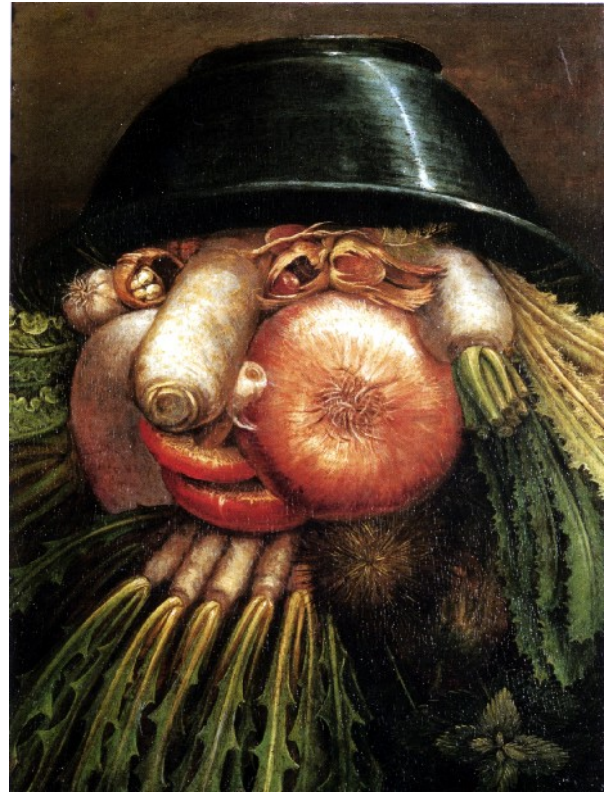
Arcimboldo, Le Jardinier 1590