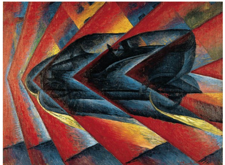
Dynamisme d'une automobile Luigi Russolo, 1912, Centre Georges Pompidou

Mouvement de réforme totale de tous les arts et de toutes les formes d'expression, le futurisme touche aussi l'architecture (Antonio Sant'Elia).