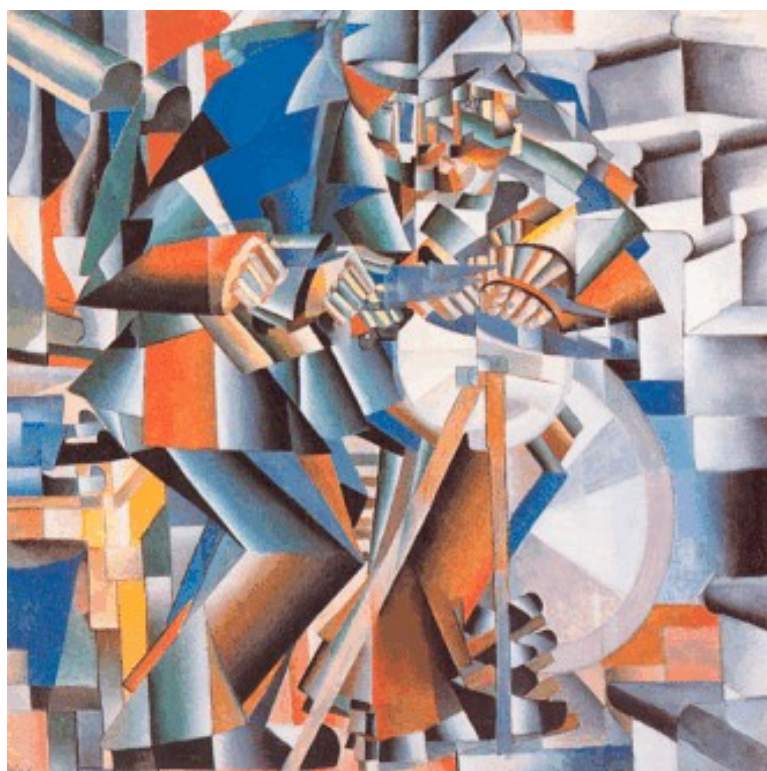
Casimir MALEVITCH: Le rémouleur