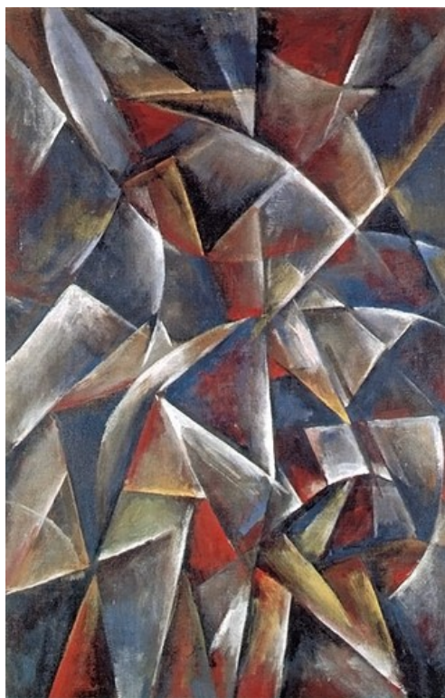
Olga Rozanova composition