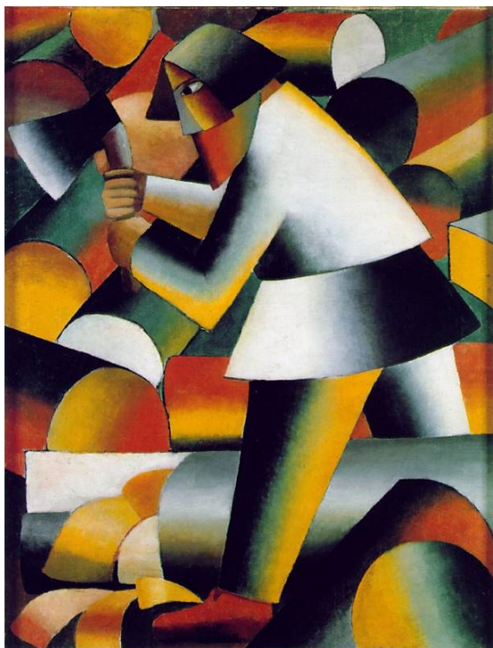
Malevitch: Le Bucheron, 1912.

Attirés par la vision subversive du mouvement italien, les artistes russes développent des tendances propres, mêlant influences primitivistes et cubistes, illustrées dans les arts plastiques par les peintures de Kazimir Malevitch qui se désigne " cubo-futuriste " en 1913, et par les œuvres de Lioubov Popova ou d' Olga Rozanova .