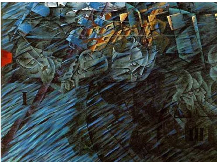
Boccioni: Ceux qui s'en vont (1911) huile